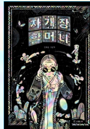
『자개장 할머니』 안효림 글·그림